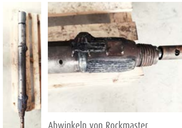
Abwinkeln von Rockmaster