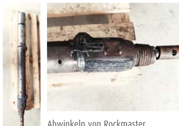
Abwinkeln von Rockmaster